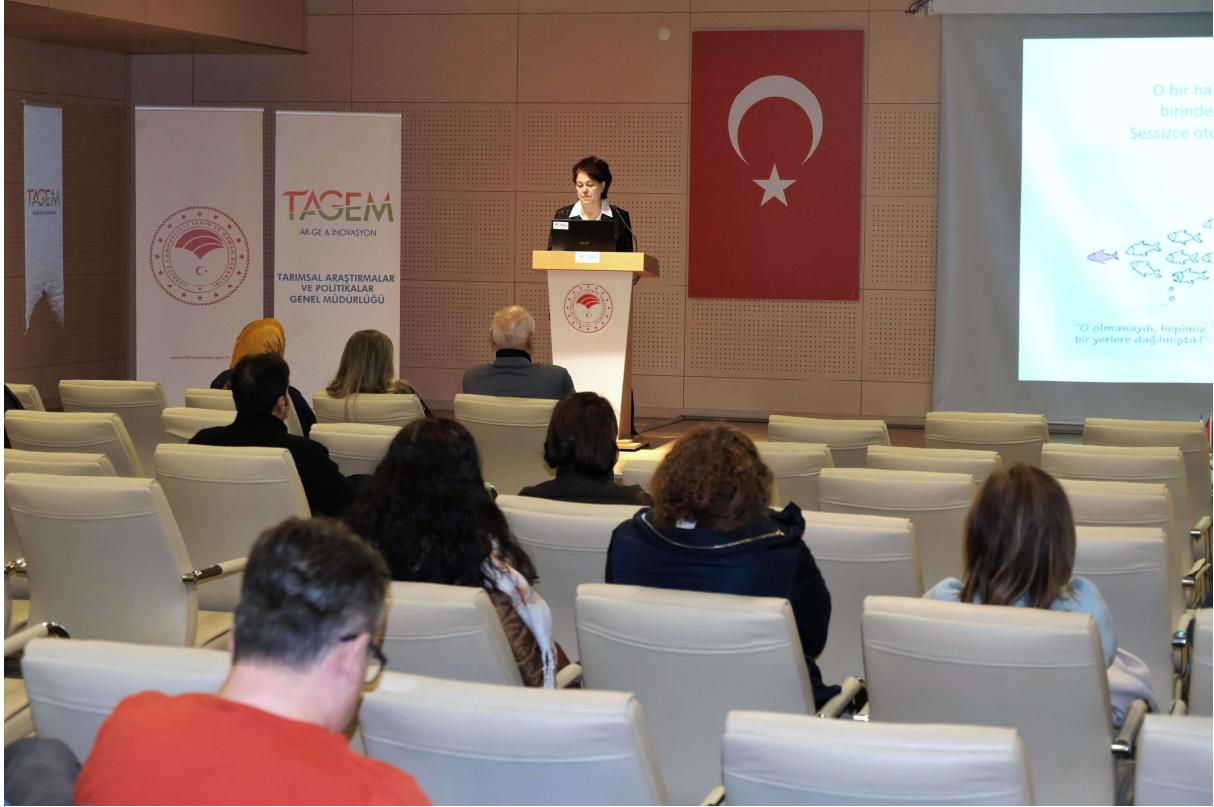
14.12.2023 tarihinde Valiliğimiz Çarşamba Hizmet Binasında İçişleri Birimleri personeline (50 kişilik) saat 11.00-12.00 de Etik İlkeler Eğitimi verilmiştir.